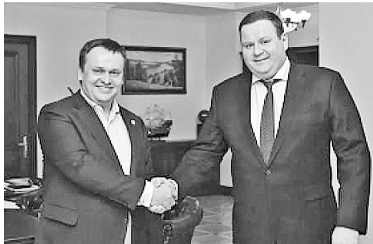
Андрей Никитин на встрече с министром труда и социальной защиты РФ Антоном Котяковым

Шла речь и о строительстве новых социальных объектов. В декабре завершено строительство новых зданий Маловишерского психоневрологического интерната «Оксочи». В этом году в Великом Новгороде начнется реализация проекта по строительству дома-интерната для престарелых и инвалидов на 200 мест с геронтологическим отделением. Оно продлится четыре года и будет проходить также в рамках национального проекта. Сметная стоимость строительства — 867 млн. рублей.