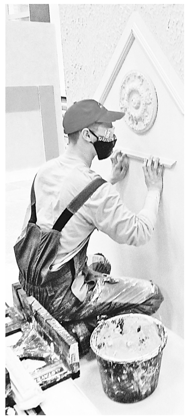
Соревнования по компетенции «Сухое строительство и штукатурные работы»

— Возможность хорошего старта при трудоустройстве, ведь за тем, как ребята на конкурсе выполняют тестовые модули, следят не только региональные и федеральные эксперты, но и потенциальные работодатели. Убеждена, что участие учебных заведений нашей области в движении WorldSkills существенно измени-