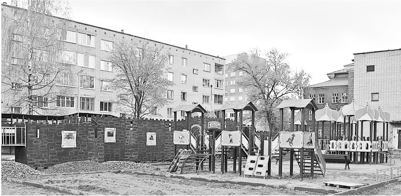
При строительстве площадки возле Центра внешкольной работы были задействованы в том числе и налоговые поступления в бюджет города (в рамках софинансирования).