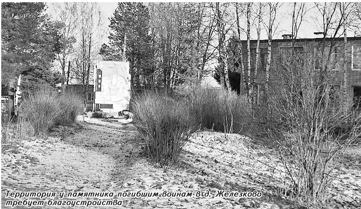
Территория у памятника погибшим воинам в д. Железково требует благоустройства