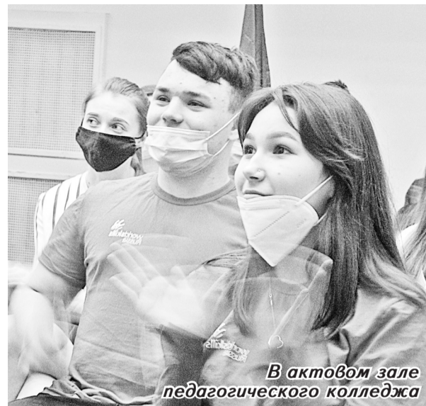
В актовом зале педагогического колледжа